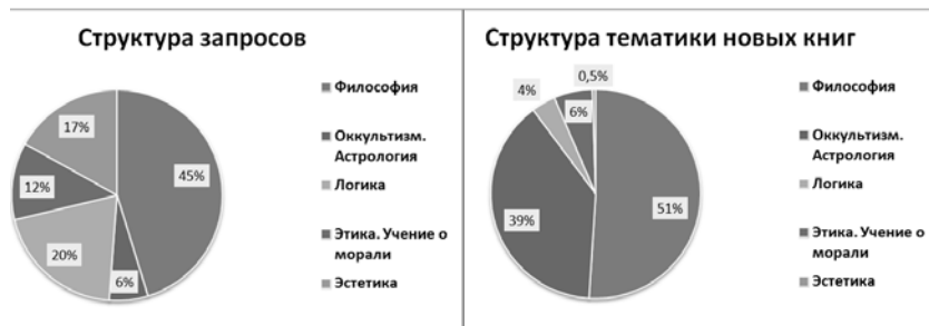
Рис. 2. Соотношение между количеством запросов и количеством вновь изданных книг по тематике «Философские науки»

Соотношение спроса и предложения знаний по такому разделу библиотечного рубрикатора, как «Философские науки», представлено на рис. 2. Полученные данные свидетельствуют, что для рубрики «Философия» имеется определенный баланс между спросом и предложением. В то же время этот баланс серьезно нарушен для таких областей, как «Логика» и особенно «Эстетика», интерес к ним со стороны научного сообщества фактически угас. Обратная картина наблюдается для подраздела «Оккультизм. Астрология», т.е. для тематики, которая пока относится к области лженауки. Поясним, что даже в условиях процветания массовой культуры «научные» продукты из этой области особым спросом не пользуются, хотя художественная литература по данной тематике популярна среди россиян.