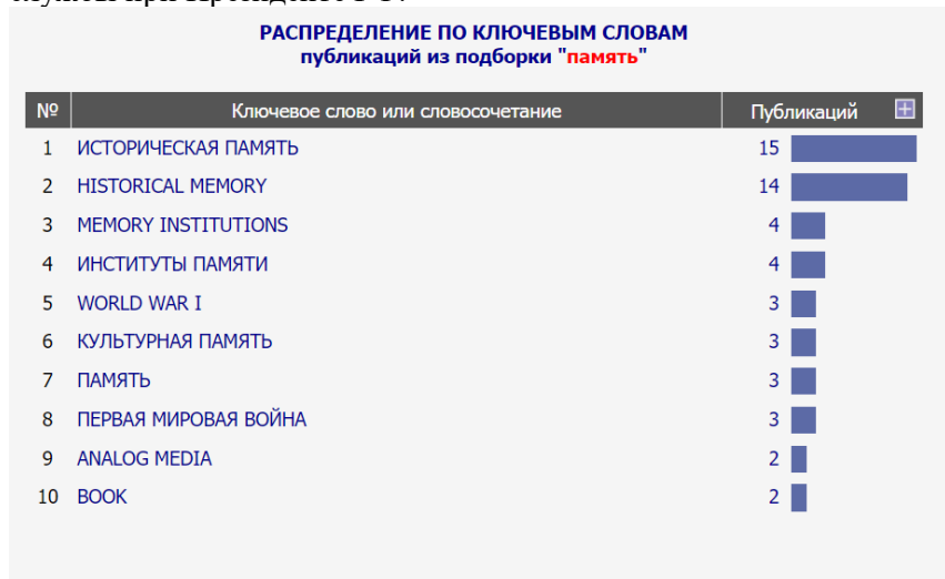
Рис. 1 Распределение ключевого слова «память» в публикациях среди журналов по библиотечным наукам

по термину «когнитивный» в журналах из данной рубрики. Всего eLibrary находит 32 публикации с ключевым словом «когнитивный» в рубрике «Библиотечные науки». Наиболее цитируемая статья Л.А. Кожевниковой с термином «когнитивные ценности» [Кожевникова, 2011]. Ведущая организация в этой подборке – Российская академия народного хозяйства и государственной службы при Президенте РФ.